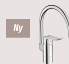
Oras Care 5738F Køkkenarmatur G3/8 Et-greb Forkromet