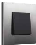
antracit rustfrit stål