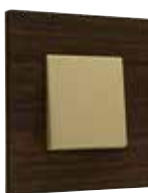
mørk bambus guld