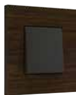
mørk bambus antracit