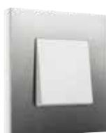
hvidt rustfrit stål