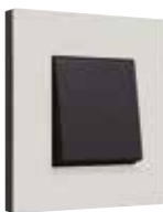
naturlig lys grå